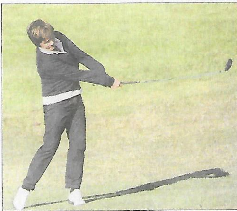
L'ancienne skieuse Annie Famose sera ce week-end sur les greens du Golf Club de Saint-Tropez pour la 22 e édition du Master des Champions.