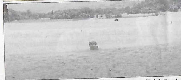
La neige s'étant invitée sur les parcours (ici à Barbaroux), le temps des papiers est venu.

Pour les compétitions du calendrier fédéral amateur, le certificat doit être enregistré sept jours avant le premier jour de l'épreuve, le questionnaire de santé complété et l'attestation enregistrée sept jours pleins avant le premier jour de l'épreuve. Du côté des organisateurs, les clubs pourront enregistrer les attestations du questionnaire de santé sur le site extranet de la fédération. De quoi motiver encore plus de golfeurs qui rechignent souvent à fournir ce certificat et qui pourront désormais s'en passer pendant trois ans, en restant toutefois vigilant sur leur santé. B. Q.